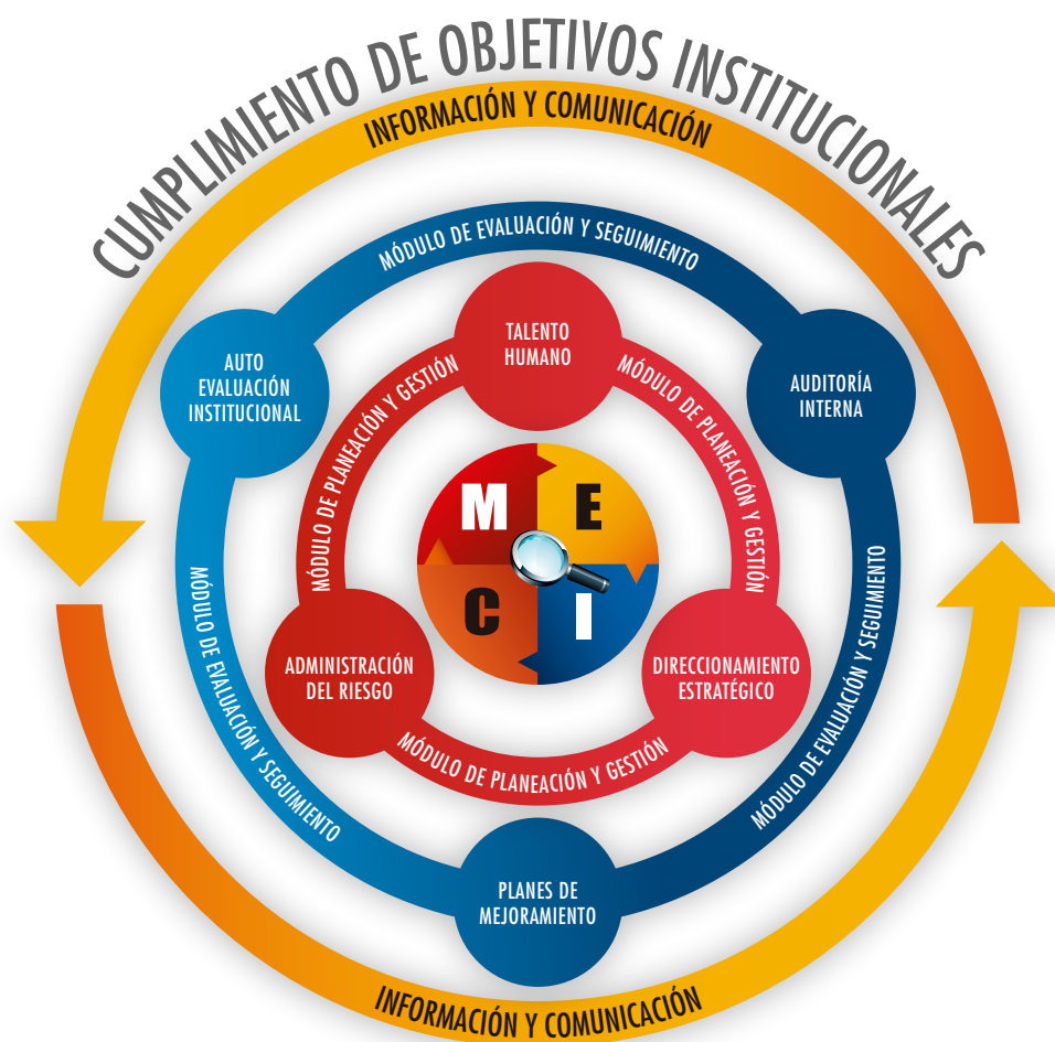
Ilustración 1. Estructura del Modelo Estándar de Control Interno

El gráfico que a continuación se muestra permite observar la estructura del MECI: